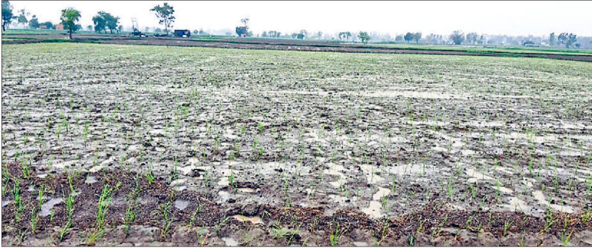
जीद। बूदाबांदी से गीले हुए खेत।

ने दिलाई राहत, रात का बिजली रही गुल: पश्चिमी विक्षोभ के चलते बुधवार को मौसम दिनभर परिवर्तनशील बना रहा। दिनभर भीषण गर्मी तथा हीट वेव ने परेशान रखा। देर रात का मौसम ने करवट ली। तेज हवा के साथ धूल उड़ने लगी। जो आंधी में तबदील हो गई। जिसके साथ बिजली भी गुल हो गई। कुछ स्थानों पर पेड़ भी टूट कर गिर गए। जिसके बाद आकाश में बादल धार आए और बूदाबांदी शुरू हो गई। जिसने आंधी तथा गर्मी से राहत दिलाई। रातों पर पड़े-पड़े रात को ही हटा दिया गया। जबकि कुछ स्थानों पर वीरवार को बिजली बहाल हो पाई। जिसके कारण लोगों