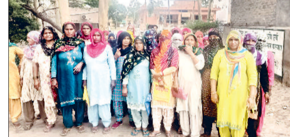
जीट। दिहाड़ी कटने पर बीडीपीओ कार्यालय पहुंचे लजवाना कलां के मजदूर।