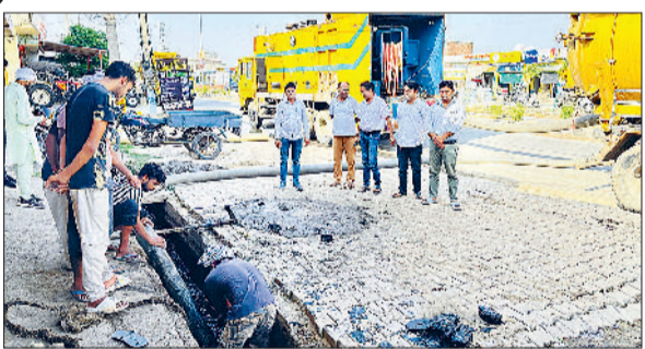
पूंडरी में मशीनों से नालों की सफाई करते हुए।

पूंडरी व फतेहपुर में अवरुद्ध नालों की सफाई करने के लिए बीडीपीओ कार्यालय व फतेहपुर पंचायत के द्वारा एक सफाई अभियान चलाया गया। डीसी कैथल के निर्देशानुसार चलाए गए इस अभियान के तहत कैथल से तीन बड़ी सड़क मशीन मंगवाई गई। जिनके द्वारा सड़क के साथ बने नालों को व्यापक स्तर पर सफाई करवाई गई। बता दें कि पिछले काफी समय से नालों में से पानी निकासी पूंडरी कैथल रोड, पूंडरी राजेंद्र रोड, पूंडरी करनाल रोड